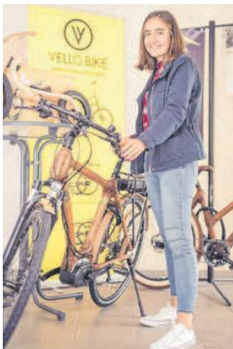
In der ebike-factory gibt es die einzigartigen my-Boo Bambus Fahrräder.

im Ländle. Diese Fahrräder sind nicht nur einzigartig sondern auch nachhaltig. Durch den Verkauf der Bambusfahrräder hilft die ebike-factory eine eigene Schule in Ghana zu finanzieren und zu betreiben. Zusätzlich wurden mehr als 40 fair bezahlte Arbeitsplätze in Ghana geschaffen. Damit sind die my-boo Bambus-Räder nachhaltig, sozial und einzigartig. MH