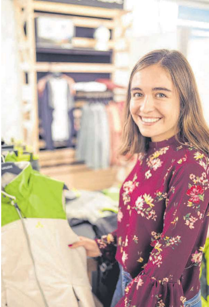
Ob In- oder Outdoor: Bei Sport Mathis findet man das passende Sportzubehör.

O'zapft is: Am 5., 6., 12. und 13. Oktober steigt im Event.Center das 10. Emser Oktoberfest mit coolen Bands und zünftiger Stimmung. Mehr Infos: www.oktoberfest.cc