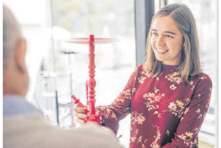
Alles, was man für eine gute Shisha braucht, findet man in Edis Shisha Shop.